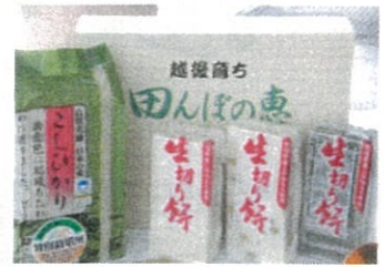
田んぼの恵セット 2,300円～